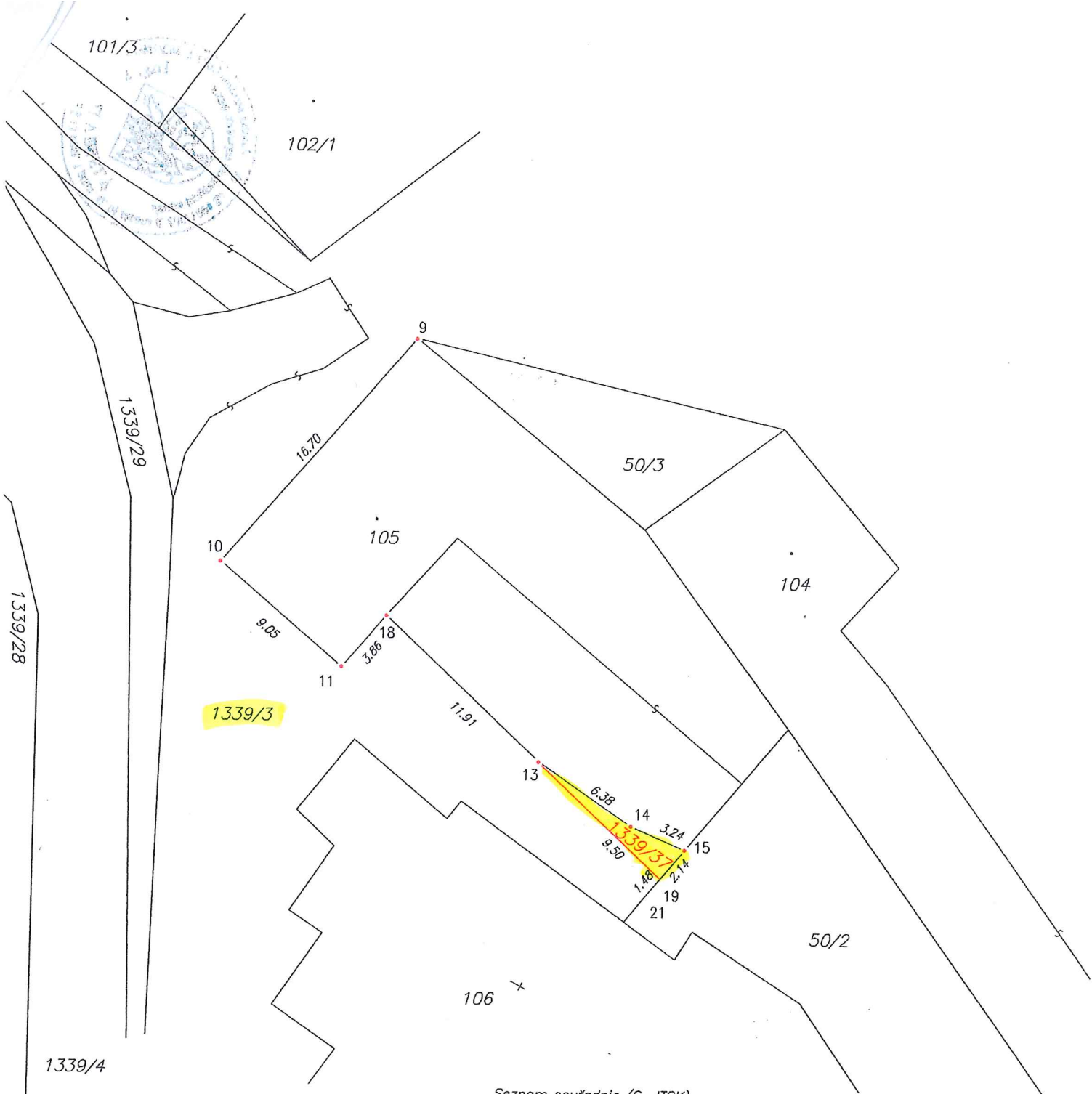
Seznam souřadnic (S-JTSK)